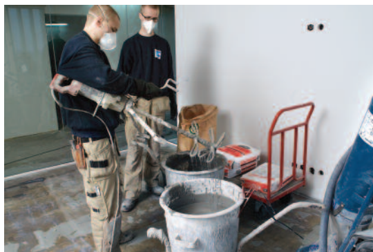
En støvsuger fjerner luftbåret støv, og der bruges åndedrætsværn.