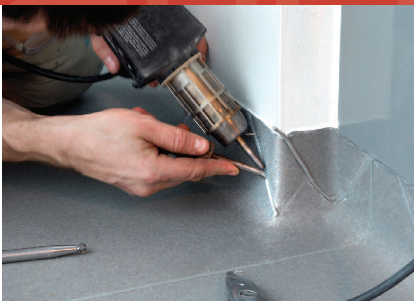
Gulvbranchens Vådums Kontrol, GVK, er den faglige instans, der godkender de færdige løsninger i de våde rum med fx hulkeler af vinyl.