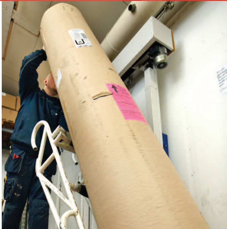
Tunge løft undgås med det rigtige grej - her en rullevojn.