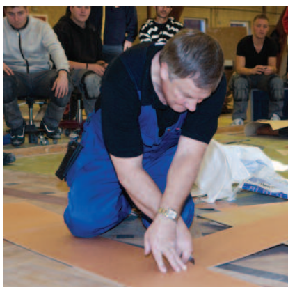
Efteruddannelse kan for eksempel foregå på Gulvlæggerskolen i Viborg, på foto handler det om nye typer af undergulv.

Der er ingen begrænsninger på antallet af ansøgninger fra den enkelte virksomhed. Når der er mange ansøgninger, gives tilskud til de ansøgninger, der er indkommet tidligst.