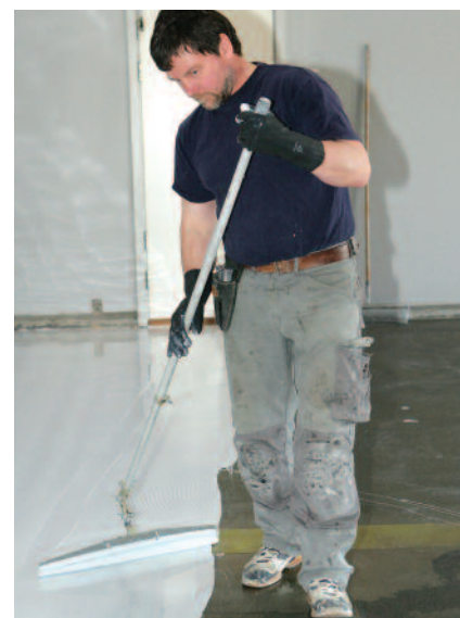
Gulvsektionen og TIB uddanner superbrugere i stående gulvlægning.

Gulvsektionen og TIB har søgt og fået midler til at fortsætte kursusprojektet Stående Gulvlægning. Otte svende vil blive uddannet til superbrugere for efterfølgende at undervise deres kolleger på arbejdspladserne i de stående værktøjer. Gulvlæggere, der aldrig tidligere har stiftet bekendtskab med stående værktøjer, tilbydes et 2-dages kursus. Gulvlæggere, der tidligere har været på kursus eller som har haft med stående værktøjer at gøre på skoleophold, tilbydes et 1-dags opfølgingskursus i de nyeste værktøjer. Kurserne udbydes i AMU regi, og arbejdsgiverne kan søge om VU-godtgørelse samt om midler fra Byggeriets Udviklingsfond. Gulvsektionen anbefaler, at så mange svende som muligt gennemgår kurserne.