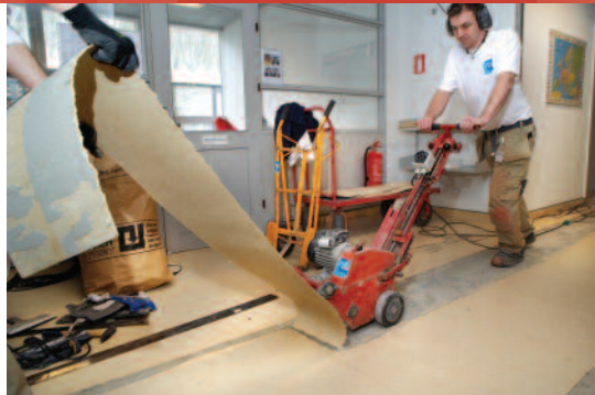
Høreværn er en selvfølge, når der fjernes gammel gulvbelægning.