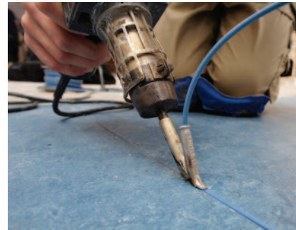
Svejseteknik er bare et af de emner, der interesserer Gulvbranchens Sekretariat.

Entreprenørmedlemmer får adgang til den nyeste viden og får indflydelse på udformningen af GULVFAKTA. Her bringes entreprenørernes anvisninger og vejledninger om, hvordan gulvene skal lægges. Entreprenørmedlemmer har fri adgang til at trække på Gulvbranchens sekretariat og de