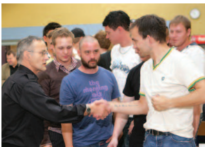
Gulvskolen i Viborg: Der uddeles svendebreve med ønsker om en god fremtid i gulvbranchen.

- Nu glæder vi os til de første svendepøver med lærlinge, også fra Viborg, men som er hjemmehørende hos virksomheder i vores del af landet, oplyser Mønster.